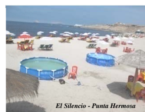
El Silencio - Punta Hermosa