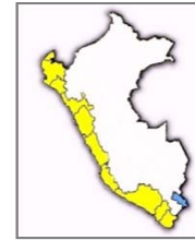
Porcentajes a Nivel Nacional