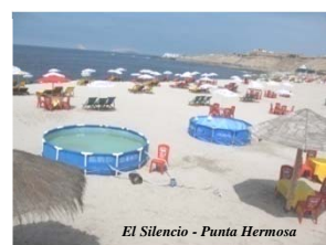
El Silencio - Punta Hermosa