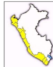
Porcentajes a Nivel Nacional