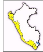
Porcentajes a Nivel Nacional