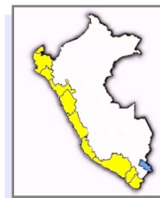
Porcentajes a Nivel Nacional