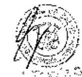
MIDDRI DE HABICH RDSPIGLISI Ministra de Salud