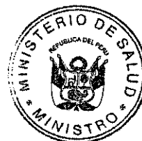
ANÍBAL VELÁSQUEZ VALDIVIA Ministro de Salud