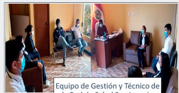
Equipo de Gestión y Técnico de la Red de Salud San Ignacio