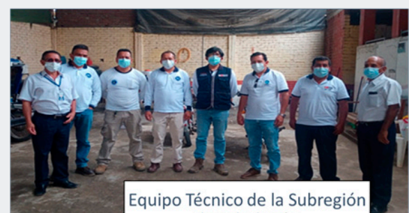
Equipo Técnico de la Subregión de Salud Jaén