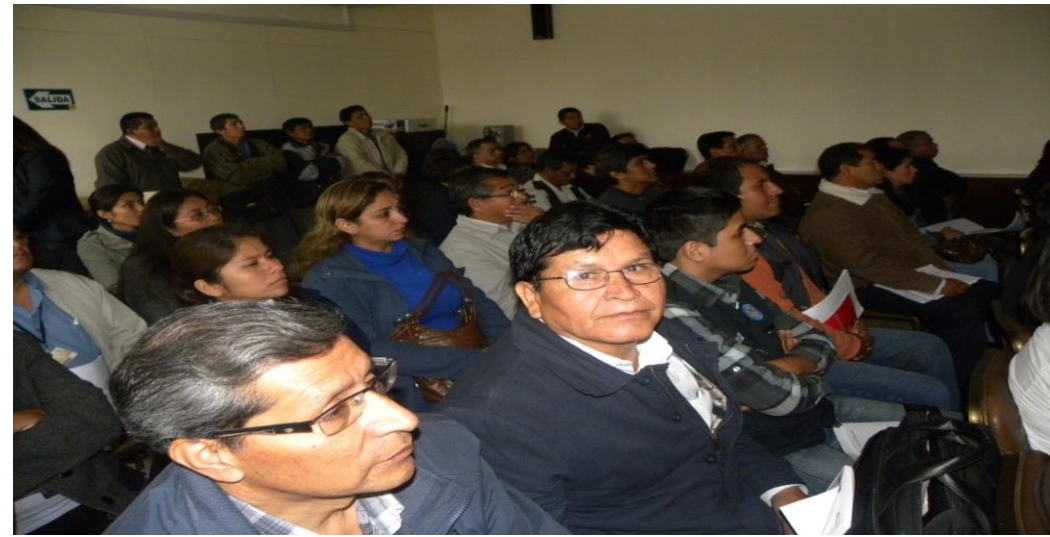
Taller Nacional en Lima Asistencia a las DISAS y DIRESAS del Perú