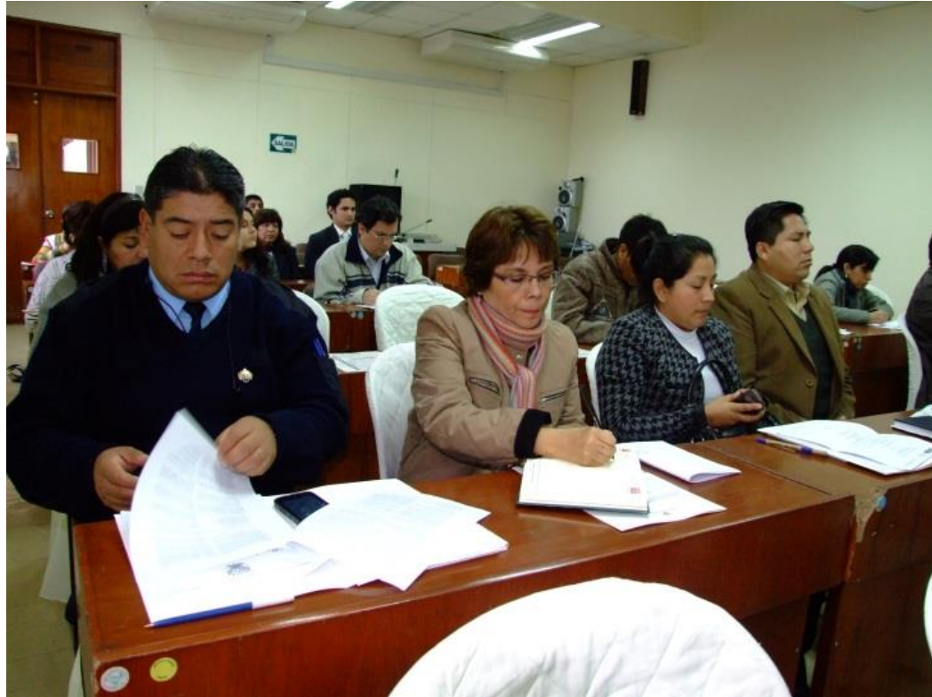
Asistencia Técnica Municipalidades de Lima y Callao

Dirección General de Salud Ambiental e Inocuidad Alimentaria