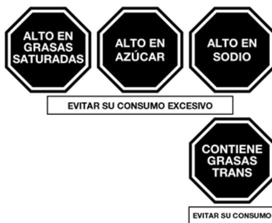
Gráfico 1: Advertencias publicitarias

El contenido de las advertencias publicitarias es el señalado en el Gráfico 1: