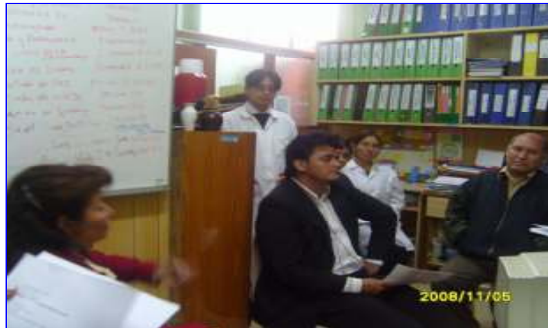
Foto N°07: Hospital Nac. Docente Madre Niño San Bartolomé: Intercambio de Experiencias Gestión Seguridad y Salud Ocupacional HNDMN San Bartolomé y Red Bagua – Amazonas.

“Decenio de las Personas con Discapacidad en el Perú” “Año de las Cumbres Mundiales en el Perú”