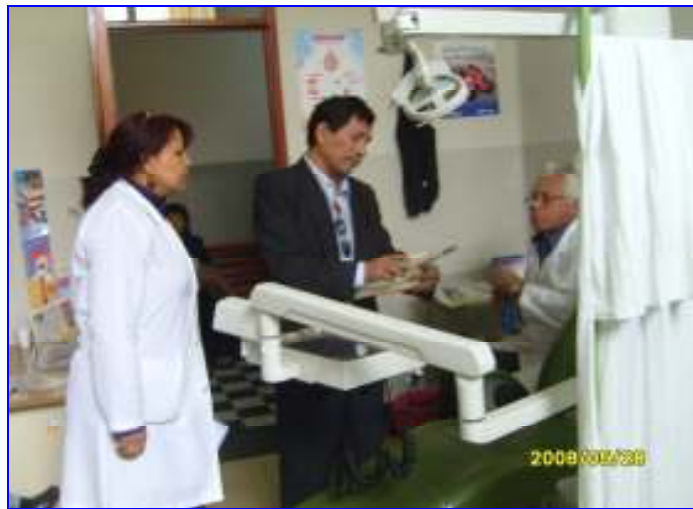
Foto N°16: DSO/DIGESA: En la Asistencia Técnica Ruido Ocupacional, Monitoreo Ruido en Ambientes de Trabajo del HNDA Carrión .

“Decenio de las Personas con Discapacidad en el Perú” “Año de las Cumbres Mundiales en el Perú”