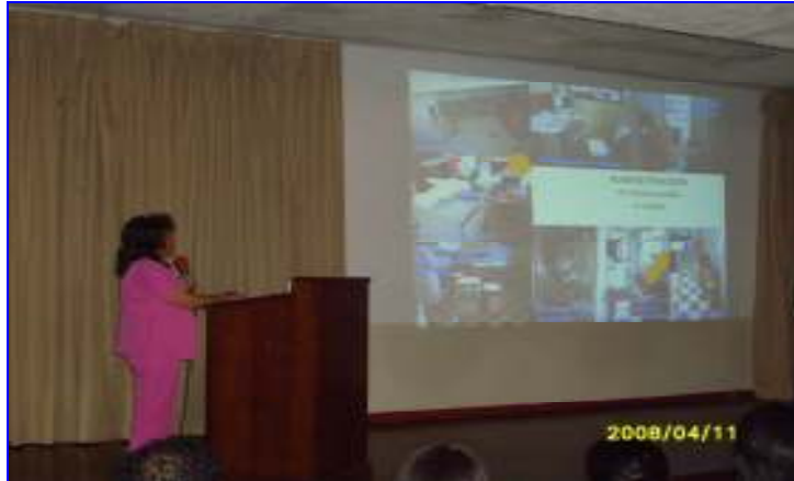
Foto N°10: Hospital Nac. Daniel Alcides Carrión: Taller Asistencia Técnica Plan Nac. Gestión Seguridad y Salud Ocupacional Hospitalaria, Evaluación Riesgos Ocupacionales dirigido a directivos, jefes de unidades y áreas, personal de salud de servicios generales, administrativos y asistencial.

“Decenio de las Personas con Discapacidad en el Perú” “Año de las Cumbres Mundiales en el Perú”