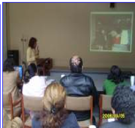
Foto N°12: Hospitales Rezola Cañete, HNDACarrión, HNDMN San Bartolomé y DISAs/DIRESAs Intercambio Experiencias en la Implementación del Plan Nac. Gestión Seguridad y Salud Ocupacional Hospitalaria dirigido a directivos Hospitales y responsables Salud Ocupacional DISAs/DIRESAs.