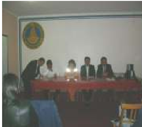
Foto N°19: Director General de Salud Diresa Amazonas, representantes de la Red de Salud Bagua, DESA/DIRESA y DSO/DIGESA.