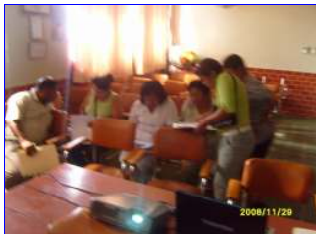
Foto N°09: Hospital JAMO – DIRESA Tumbes: Taller Asistencia Técnica Plan Nac. Gestión Seguridad y Salud Ocupacional Hospitalaria, Evaluación Riesgos Ocupacionales dirigido a directivos, jefes de unidades y areas, personal de salud.