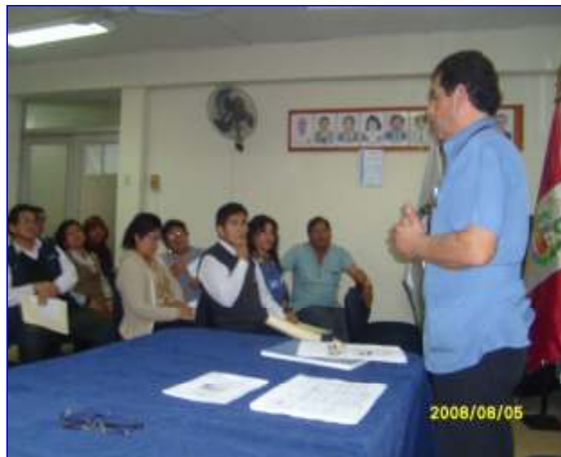
Foto N°17: DIRESA Lima: Taller Asistencia Técnica Hospital Rezola Cañete en Implementación Gestión Seguridad y Salud Ocupacional Hospitalaria.