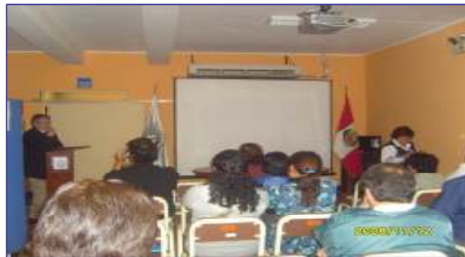
Foto N°05: DISA V Lima Ciudad: Hospital Emergencias Pediátricas. Taller Asistencia Técnica Gestión Seguridad y Salud Ocupacional personal de salud Directivos, Jefes de Unidades y areas y trabajadores administrativos y asistencias y servicios.