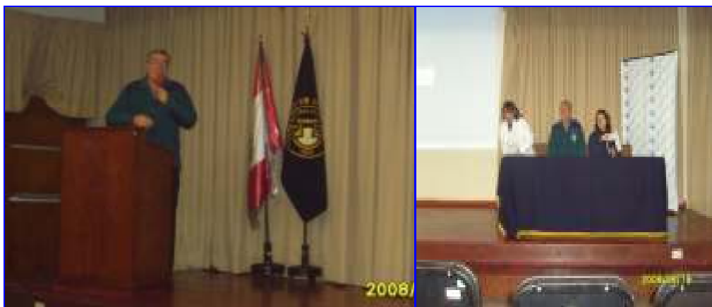
Foto N°15: Director General del Hospital Nac. Daniel Alcides Carrión participando en la Implementación de la GSSO Hospitalaria.

www.digesa.minsa.gob.pe www.digesa.sld.pe