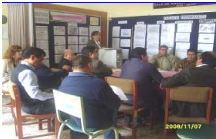
Foto N°06: DISA I Callao: Hospital Nac. Daniel Alcides Carrión: Evaluación y Avances en la Implementación Gestión Seguridad y Salud Ocupacional, dirigido a Directivos DSO/DIGESA y DISA Lima y Callao.