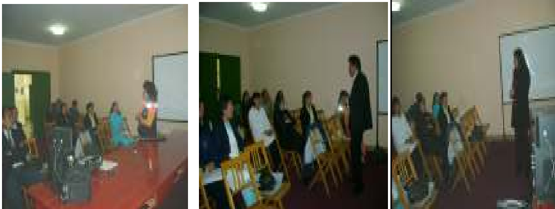
Foto N°20: Participantes y ponentes de la DSO/DIGESA, Red de Salud Bagua, DESA/DIRESA – Amazonas Dirección Regional Trabajo y Promoción Empleo, , Red de Salud Utcubamba, Hospitales.