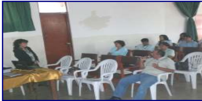
Foto N°04: DIRESA Tumbes: Taller Asistencia Técnica Gestión Seguridad y Salud Ocupacional personal Hospital JAMO - MINSA, Hospital Fuerzas Armadas (Marina, Ejército), Policía y EsSALUD.

“Decenio de las Personas con Discapacidad en el Perú” “Año de las Cumbres Mundiales en el Perú”