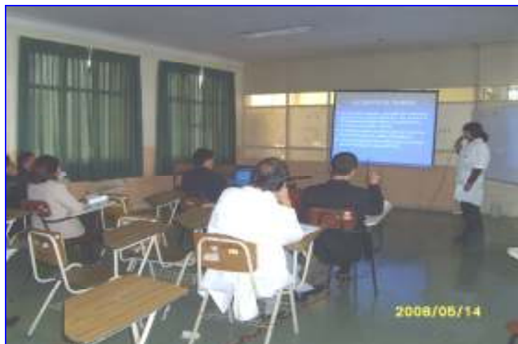
Foto N°14: HNDA Carrión: Capacitación al Comité de Seguridad y Salud Ocupacional