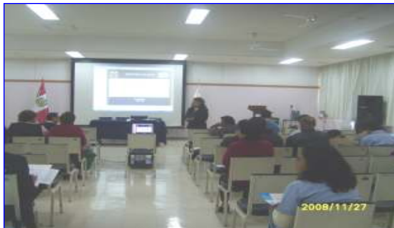
Foto N°08: Instituto Nac. Materno Perinatal: Plan Nac. Gestión Seguridad y Salud Ocupacional Hospitalaria dirigido a Hospitales y Redes de Salud.