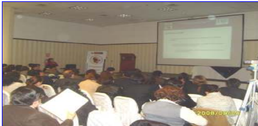
Foto N°11: Seminario Internacional Salud Ocupacional: Plan Nac. Gestión Seguridad y Salud Ocupacional Hospitalaria dirigido a directivos y responsables Salud Ocupacional DISAs/DIRESAs.