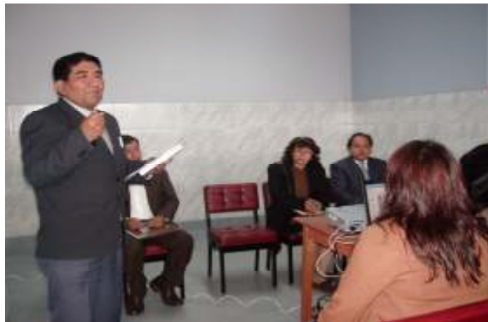
Foto N°22: Director General de Salud DIRESA Cuzco, representantes de la Dirección Salud Ocupacional DESA/DIRESA Cuzco y DSO/DIGESA.