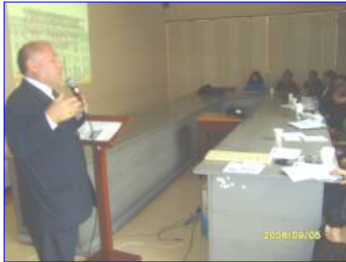
Foto N°13: HNDMN San Bartolomé presentando los avances en la Implementación de la Gestión Seguridad y Salud Ocupacional Hospitalaria a las DISAs/DIRESAs.

“Decenio de las Personas con Discapacidad en el Perú” “Año de las Cumbres Mundiales en el Perú”