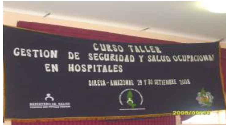
Foto N°18: Evento “Gestión Seguridad y Salud Ocupacional en Hospitales DIRESA – Amazonas 29 y 30 Set 2008”.

“Decenio de las Personas con Discapacidad en el Perú” “Año de las Cumbres Mundiales en el Perú”