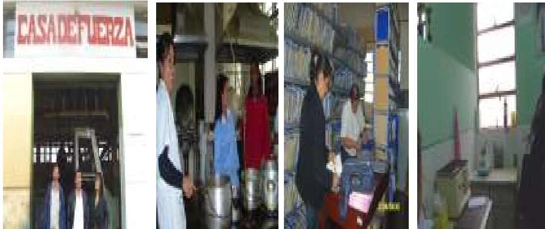
Foto N°21: Taller de Evaluación de Riesgos Ocupacionales en las Áreas de Trabajo: Planta Fuerza, Nutrición, Archivo, Laboratorio Biología del Hospital Nac. Virgen de Fátima – DIRESA Amazonas.

“Decenio de las Personas con Discapacidad en el Perú” “Año de las Cumbres Mundiales en el Perú”