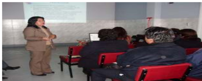
Foto N°23: Responsable Salud Ocupacional Hospital A. Lorena - DIRESA Cuzco en la presentación del estudio Base Social Trabajadores de Salud del Hospital, perfil de riesgos ocupacionales y perfil epidemiológico.